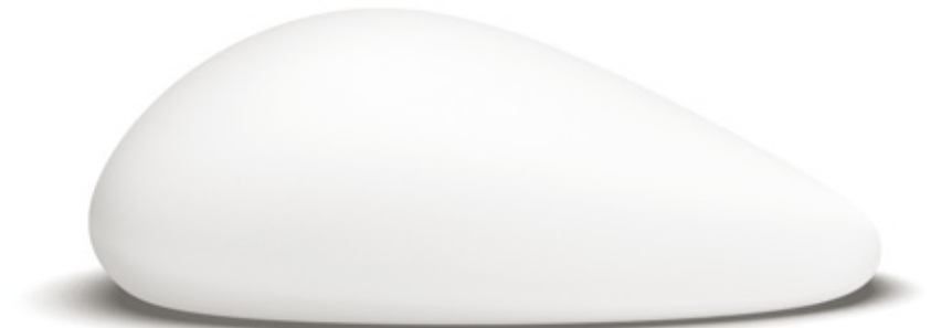
Anatomicky tvarovaný implantát

Získajte viac informácií o rozdielnych typoch implantátov, tvaroch, veľkostiach a zistite, ktorý implantát by mohol byť ten správny pre Vás na www.eurosilicone.sk .